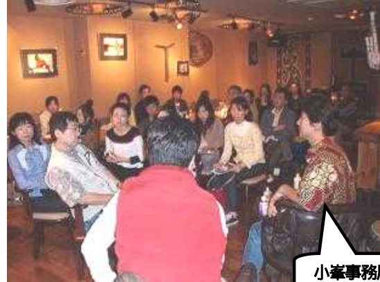
来場者とのトークセッション