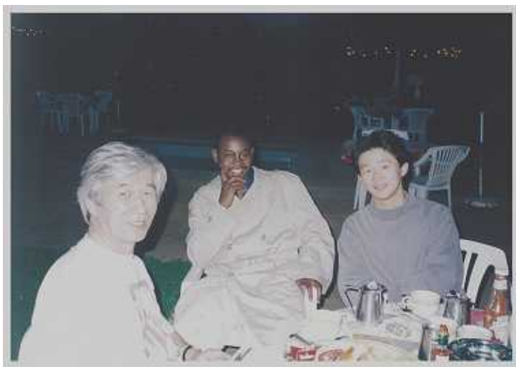
1999年3月、キガリのウムパノ・ホテルで